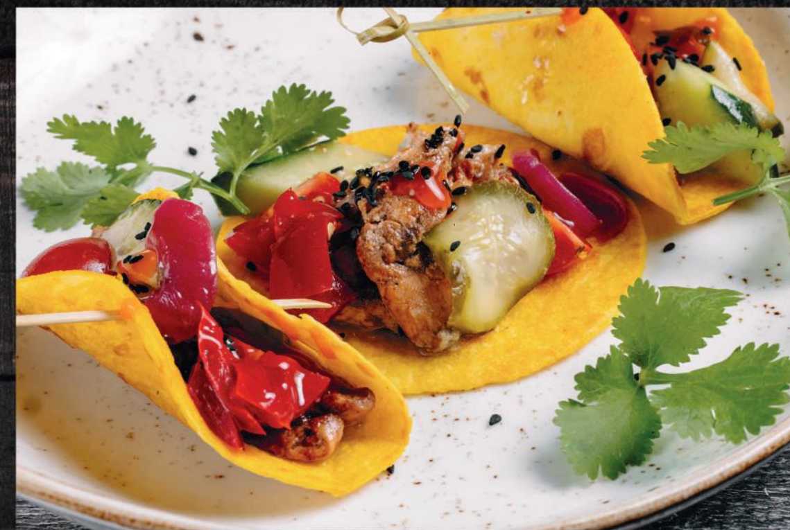
ТАКО С ЦЫПЛЕНКОМ С КРЕМОМ КЕШЬЮ И СЕМЕЧКАМИ ПОДСОЛНУХА

МЯСО ЦЫПЛЕНКА, МАРИНОВАННЫЕ ОВОЩИ, ПОМИДОРЫ ЧЕРРИ, БИТЫЕ ОГУРЦЫ, ЗЕЛЕНЬ КИНЗЫ