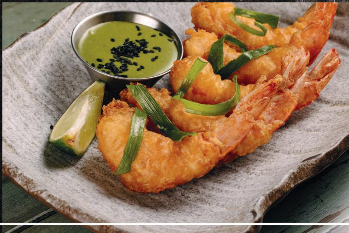
ТИГРОВАЯ КРЕВЕТКА ТЕМПУРА С ПЯНЫМ ЗЕЛЕНЫМ СОУСОМ Выход 5 шт / 40г / 15г 890 ₺