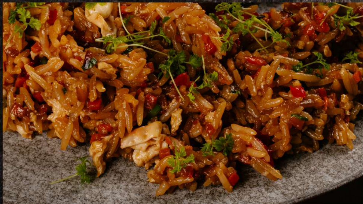
РИС БАСМАТИ С ОВОЩАМИ