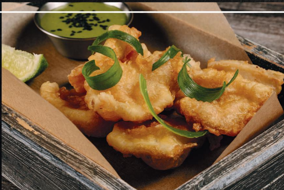
КАЛЬМАР ТЕМПУРА С ПЯНЫМ ЗЕЛЕНЫМ СОУСОМ Выход 110г / 40г / 15г 630 ₺